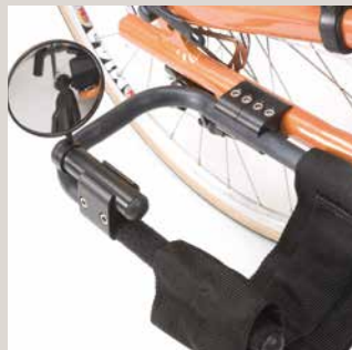
Speil montert på fotstøtten.