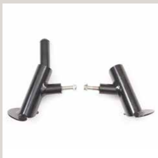
Håndpedaler med power-plater.