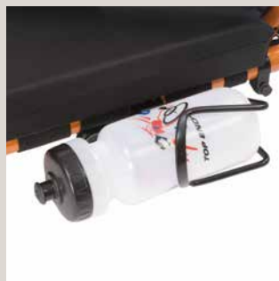
Vannflaske montert på rammen.