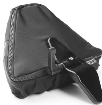
Thoracic support (ATS)