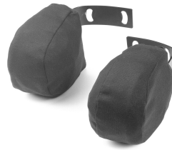
Lateral support (ABL)