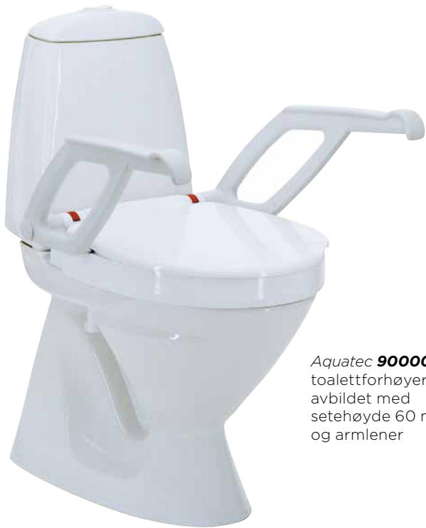
Aquatec 90000 toalettforhøyer avbildet med setehøyde 60 mm og armlener