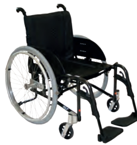
XLT Swing - Post 3

Prisforhandlet i antrasitt sort rammefarge.