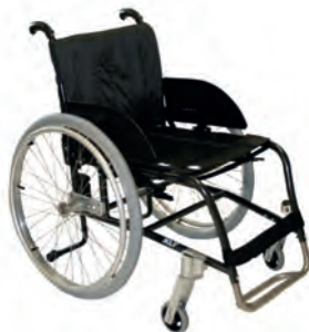
XLT dynamic 90° - Post 2

Prisforhandlet i antrasitt sort rammefarge.