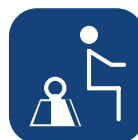
Maks. brukervekt ▼