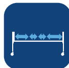
Liggeflate mål ▼