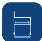
Innvendig bredde Utvendig bredde ▼

Vennligst se våre hjemmesider for brukermanual samt mer informasjon om produktet.