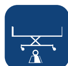
Total vekt (uten endegavel) ▼