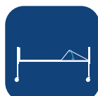
Lår vinkel ▼