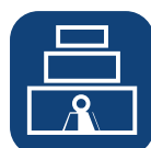
Tyngste del av produktet ▼