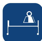
Maks brukervekt ▼