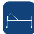
Rygg vinkel ▼