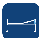
Legg vinkel ▼