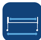
Lengde innside Lengde utvendig ▼