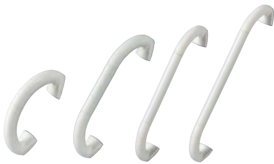
Invacare H140 - H144