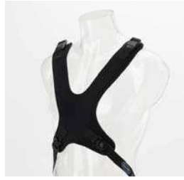
Dynamic sele Antal: 1