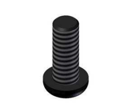
Flo-tech PT Monterings- skruvar Antal: 2