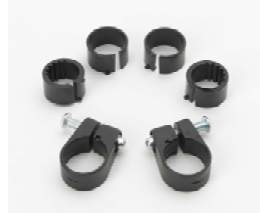
Monteringssats Antal: 2