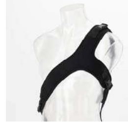
Y-style sele Antal: 1