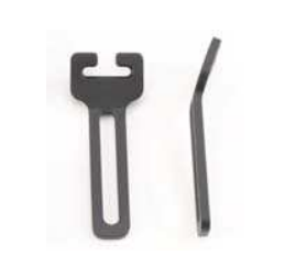
Monteringsfästen Antal: Par