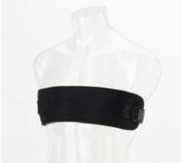
Dynamic bröstbälte Antal: 1