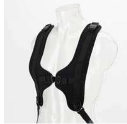
Shoulder sele Antal: 1