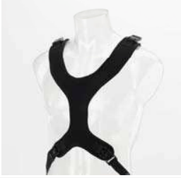
Sternum sele Antal: 1