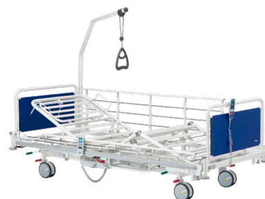
► Invacare® SB 910