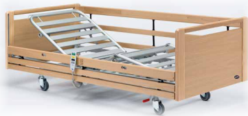
► Invacare® SB 755