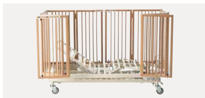
ScanBeta NG utstyrt med 800 mm doble dører Doble sidedører i bøk og plexi med sikkerhetslås, kan åpnes 180°. Krever mindre plass i rommet.