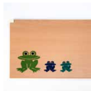
Klistremerker Velg mellom ulike klistremerker for å dekorere sengen.