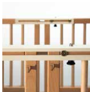
Sikkerhetslås som kun åpnes via to forskjellige låsefunksjoner.