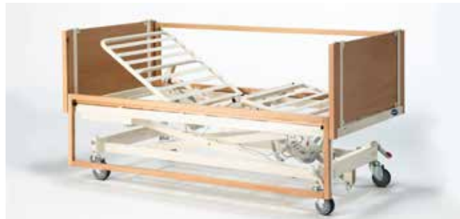
ScanBeta NG utstyrt med 400 mm nedfellbar og fast sidegrind i plexi