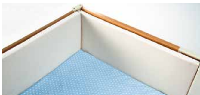
Polstring 30 mm tykk polstring for alle typer endegavler og sidegrinder.