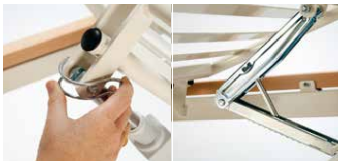
Konfigurering av liggeflate Liggeflatens funksjonalitet kan opp- eller nedjusteres i takt med behov: tilføyning/fjerning av motorer og rastofix (se skjema side 6).