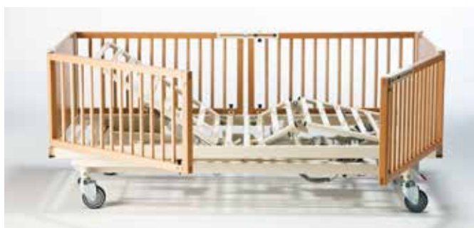
ScanBeta NG utstyrt med 400 mm dører Dører i bøk og plexi med sikkerhetslås, kan åpnes 180°.